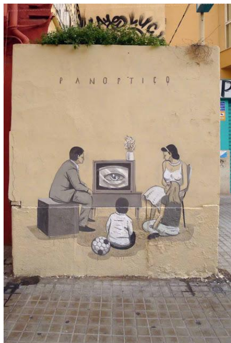
Fig. 2. y Fig. 3 Taller de Medios. La comunicación Televisiva. Escif. "Panóptico" y "Libertad de prensa". Calles de Valencia, España 2012.